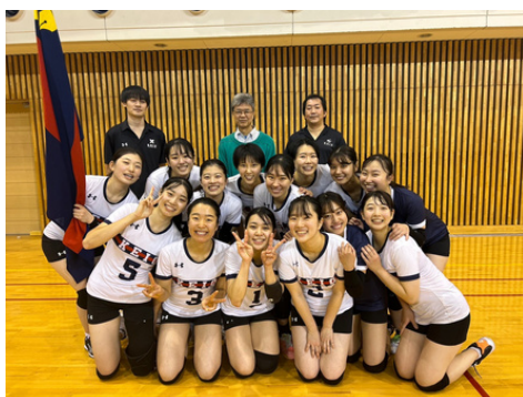
2023年秋季関東大学リーグ戦