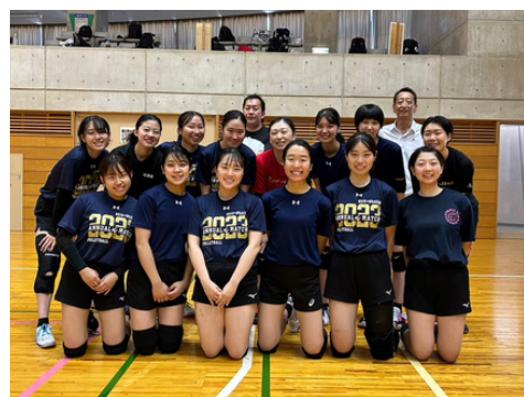
柿崎での夏合宿の様子